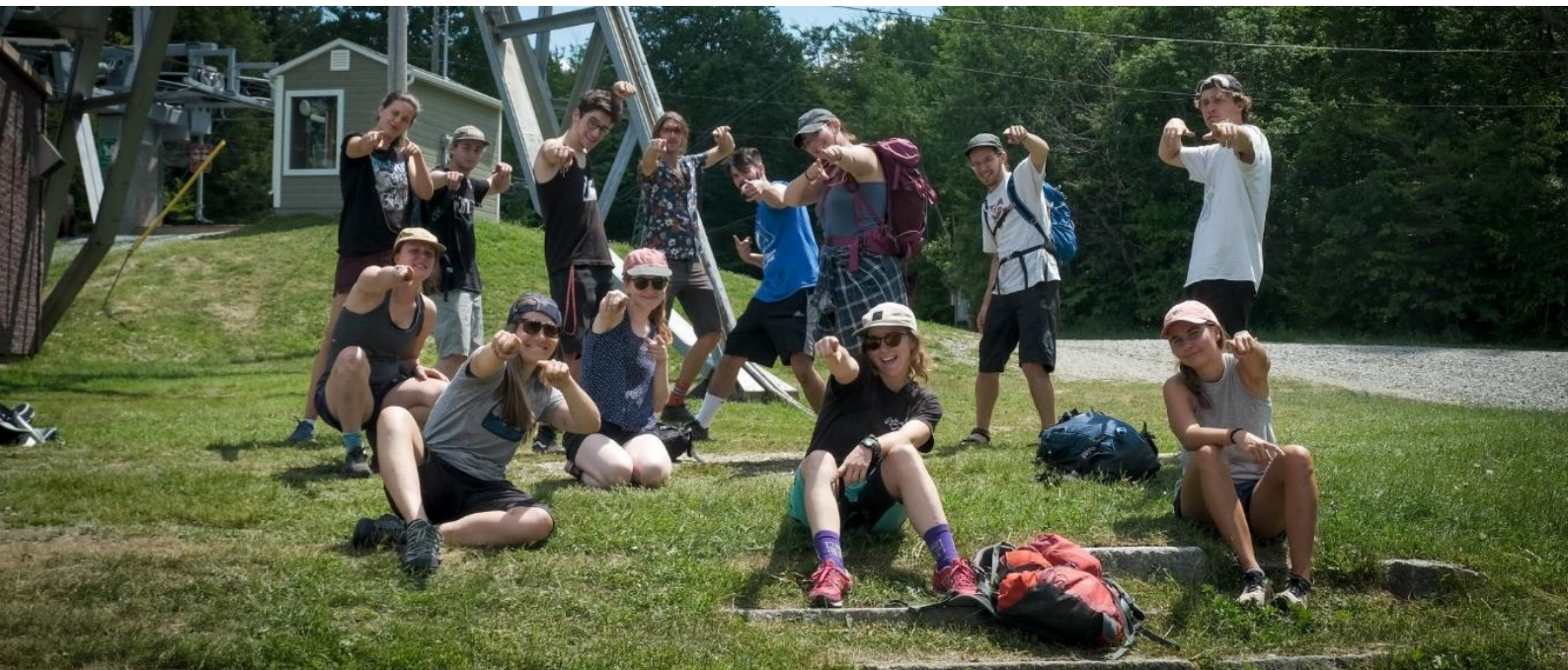
Équipe d'animation – Été 2020

La salle communautaire était réservée pour un total de 52 jours par différents citoyens, organismes et entreprises et sur ce nombre, 14 journées ont été annulées pour différentes raisons découlant de la pandémie COVID-19 : protection des membres vulnérables de la famille et amis, restriction quant au nombre d'invités permis, mesures sanitaires à mettre en place pour que l'événement ait lieu, interdiction de se rassembler et interdiction de louer la salle.