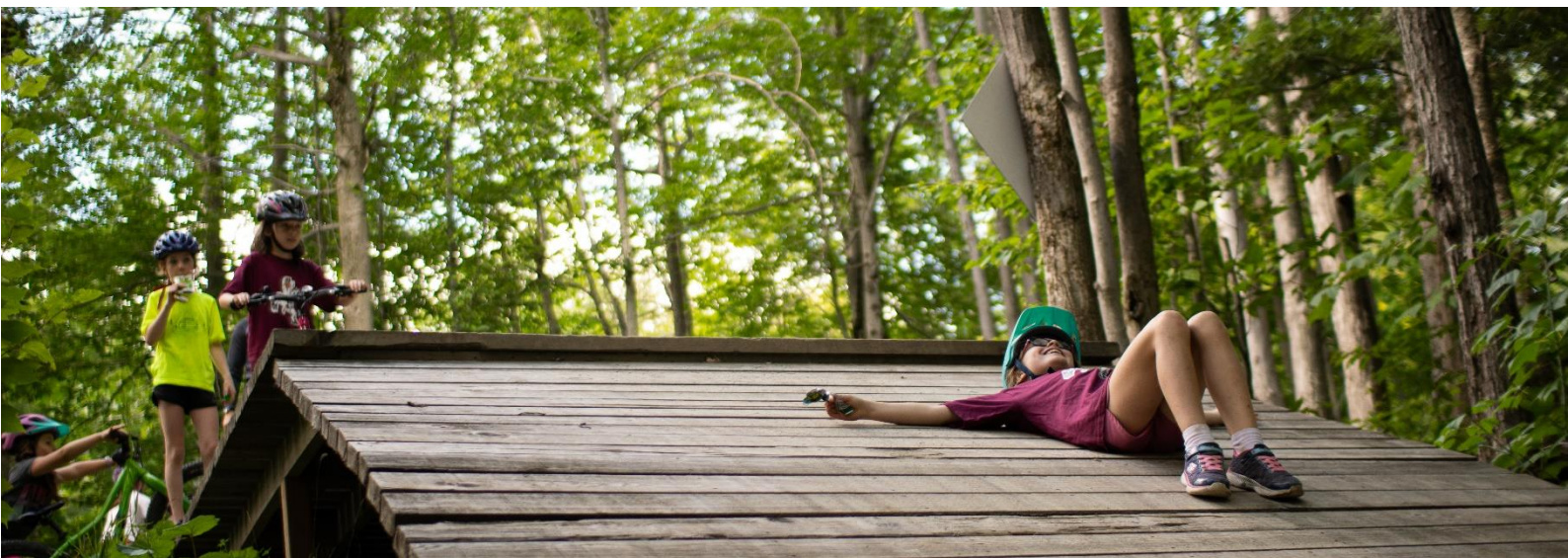
Camp « Plein air 100% Filles » Carbure Aventure - Été 2020

Pour la deuxième année d'activités de Carbure Aventure, le conseil d'administration avait mentionné l'importance de consolider les acquis pour assurer un développement sain de l'organisme. L'équipe de direction a écouté ce sage conseil et a su relever le défi! Cette année 2019-2020, agrémentée d'une pandémie, aura tout de même été une année marquée d'une hausse importante du nombre de participantes et participants aux activités. Le présent rapport en fait mention et résume les principales activités ayant eu lieu durant l'année, divisée par saison.